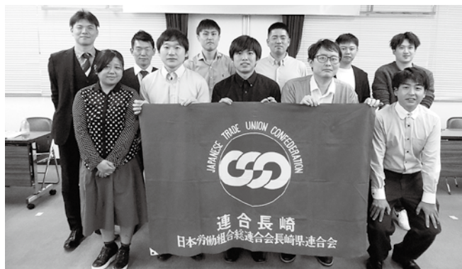
2025年度 連合長崎青年委員会新役員