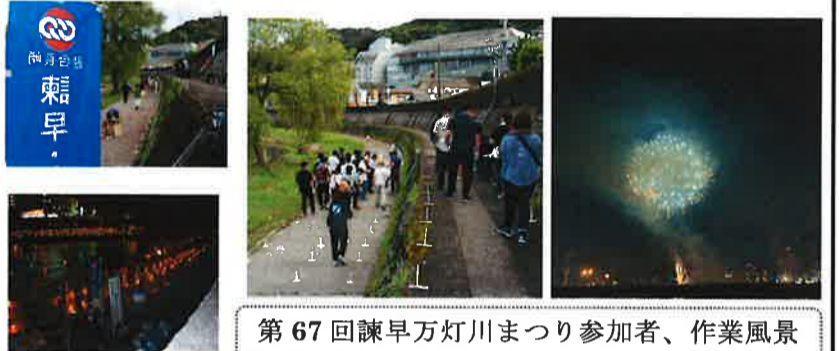
第67回諫早万灯川まつり参加者、作業風景

次年度も多くの皆さんの参加をお願いいたします。又、本年度も花火2000発も打ち上げられました。勤務終了後に参加いただいた組合員の皆さんお疲れさまでした。