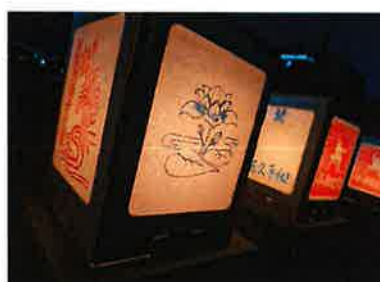
平和行動 in 長崎 ナガサキ集会・ピースウォーク・万灯流し