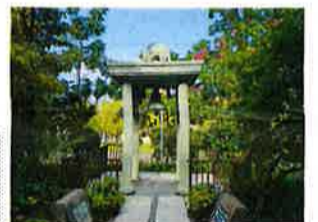
平和行動 in 広島 ピースフラッグリレー 原爆ドーム・平和の鐘→ 写真 連合長崎ホームページより