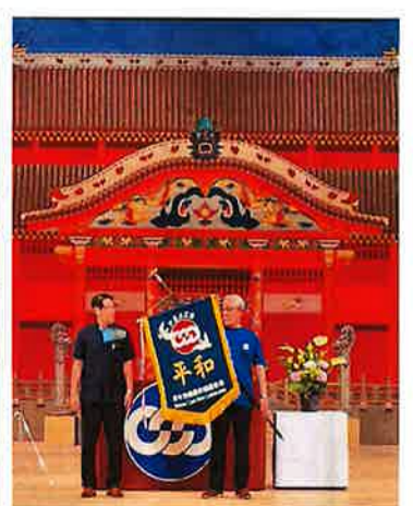
平和行動 in 沖縄 長崎集合写真