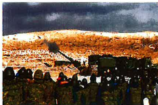
日出生台での演習をやめさせよう!