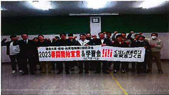
春闘開始宣言 & 学習会