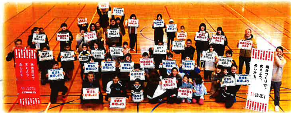
春闘開始宣言後、アピールボードを持って集合写真

その他 連合長崎対馬ブロック春闘開始宣言終了後、対馬地区労福協との合同レクリエーションを開催