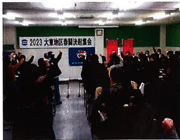
団結してガンバロー!!