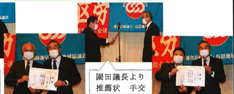
園田議長より推薦状 手交