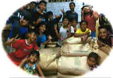
到着のお米の前で喜ぶくっくま孤児院の皆様