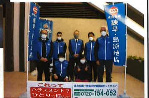
これってハラスメント? ひどい悩んでいませんか? 連合なんでも労働相談ホットライン 0120-154-052