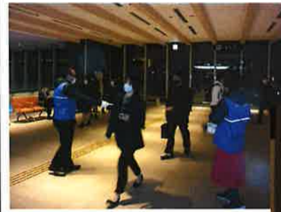
テッシュ配布街頭行動↑ 諫早地区参加者集合写真

「もしかしてこれってセクハラ?・パワハラ?・マタハラ? つらい・・・」など、身近に相談出来ず悩んでいるとき、大切なのは決して一人で悩まないことです。信頼できる先輩や同僚・上司、労働組合などに相談しましょう。また、身近に相談出来ないなど一人で悩んでいる時は、 連合なんでも労働相談ホットライン・0120-154-052 へ連絡してください。本日の諫早地区街頭行動には、構成組織と事務局の参加者8名で実施、皆さん寒い中での取り組みありがとうございました。