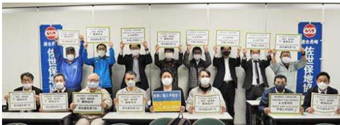
【3月15日：第4回佐世保地協幹事会終了後】