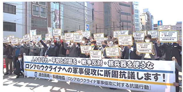
【3月12日：長崎市内／鉄橋】