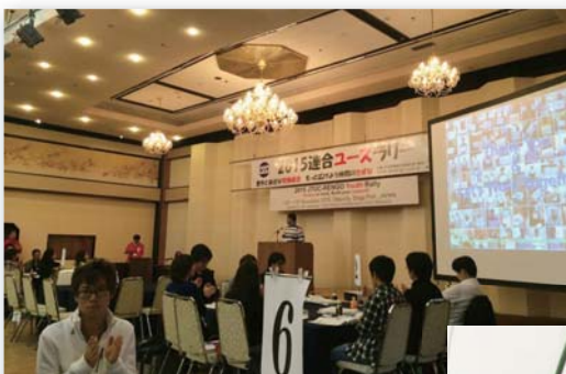
アジアの青年労働運動についての講演

3日目は、2日目のグループディスカッションの結果を班別に発表し、2015連合ユースラリーを締めくくりました。