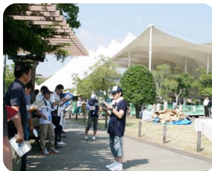
平和行動in長崎 (ピースウォーク)