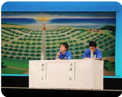
平和行動in沖縄 (パネルディスカッション)

平和行動in長崎のピースウォークでは、連合長崎青年委員会・女性委員会メンバーによる「ピースガイド」の案内で、原爆落下中心地公園・平和公園内の8箇所のモニュメント・碑巡りを行いました。