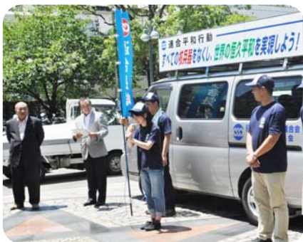
平和キャラバン隊 (出発式)