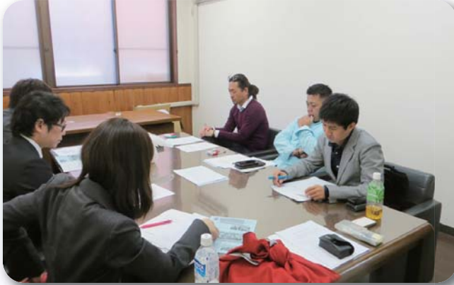
全駐労青年部との組織交流

ス・フォローを行うこと等を目的に、昨年から構成組織青年部を訪問し、意見交換を行っています。今年10月31日に全駐労青年部、11月14日に全労金青年部を訪問し、連携強化を図りました。