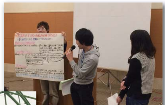
グループディスカッション