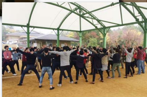
チームワークビルディング