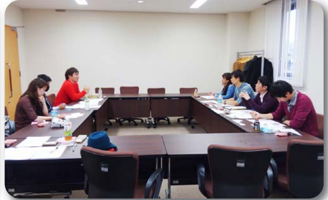
全労金青年部との組織交流