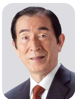
民進党長崎県総支部連合会 代表(前衆議院議員) 高木 義明