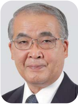
長崎県知事 中村 法道