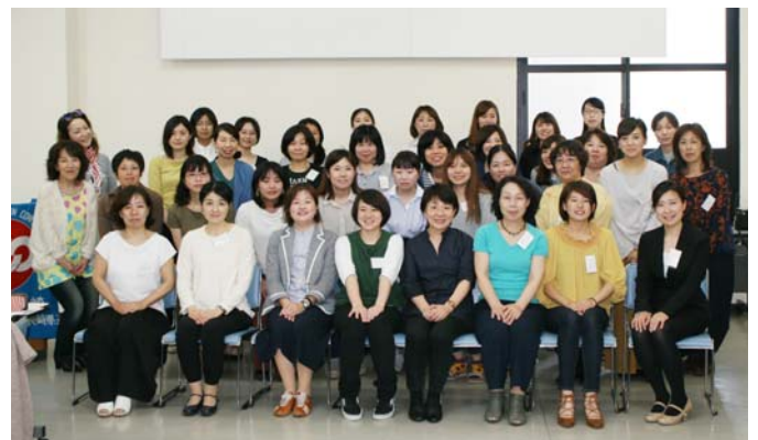
たくさんの皆様のご参加ありがとうございました

午後からは、「組合役員をされていてよかったこと」「組合役員をされていて困ったこと」などいくつかのテーマを設けて、ワークショップ方式でみんなで意見を出し合いました。なかなか正解はないですが、「職場が違って同じような悩みがある」「課題が共有できてよかった」など交流の成果が出ていたようです。1日に渡る研修会でしたが、参加してくださった皆様、ありがとうございました。