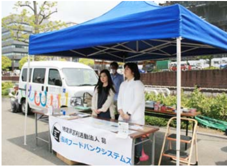
フードドライブ(長崎会場)

5月1日に開催されたメーデーでは7ヶ所の会場でフードドライブを実施しました。フードドライブとは、ご家庭で余っている食料品を持ち寄っていただく取り組みで、集まった食料品(お米・乾麺・缶詰など)はフードバンク(長崎フードバンクシステムズ)を通じて、必要とされている方に寄付をいたしました。皆様の協力に感謝いたします。