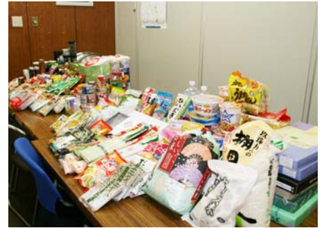
たくさんの食料品 ありがとうございました