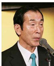
高木 義明様 (衆議院議員)