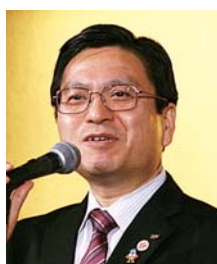
石塚 孝様 (長崎県副知事)