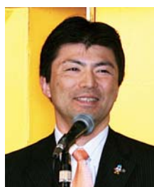
古賀 友一郎様 (長崎市市長)