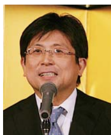
宮島 大典様 (前衆議院議員)