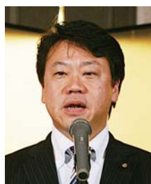
大久保 潔重様 (参議院議員)