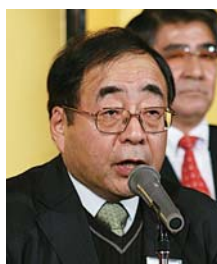
松永 隆志様 (諫早市議会議員)