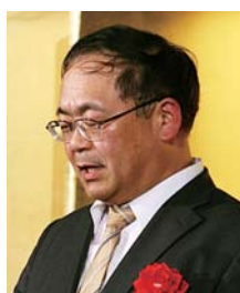
中原 正裕様 (長崎労働局長)