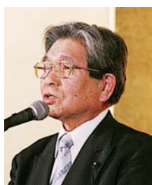
吉村 庄二様 (社民党県連合代表)