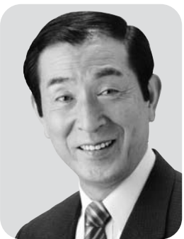
衆議院議員 高木 義明

連合は、引き続き被災地の復興・再生に全力を尽くし、「働くことを軸とする安心社会」の実現に邁進してまいります。本年も、連合へのご支援を賜りますようお願い申し上げます。