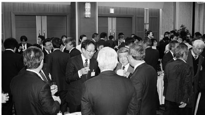
歓談する参加者のみなさん