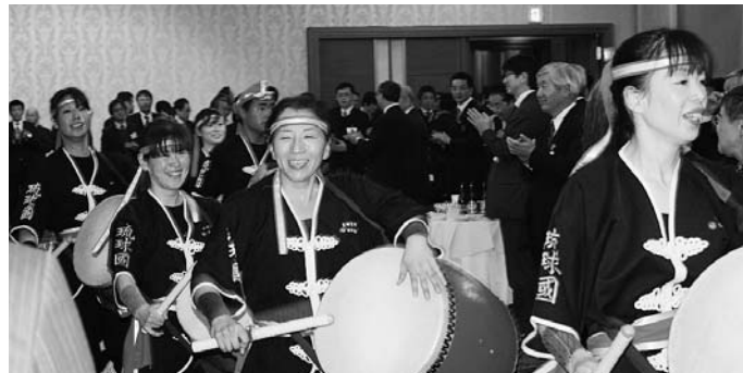
琉球國祭り太鼓の演舞