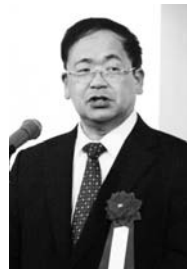
中原 正裕様 (長崎労働局長)