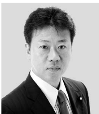
参議院議員 大久保 潔重