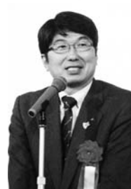
田上 富久様 (長崎市長)