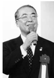
中村 法道様 (長崎県知事)