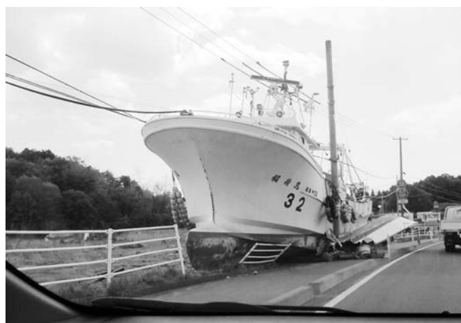
福島県相馬町の現況