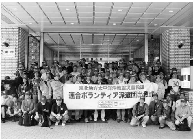
連合本部第6陣として被災地に出発

連合本部に11時30分に集合し、ボランティア活動に関するオリエンテーションが行なわれた。その後12時にバスで福島県猪苗代町の