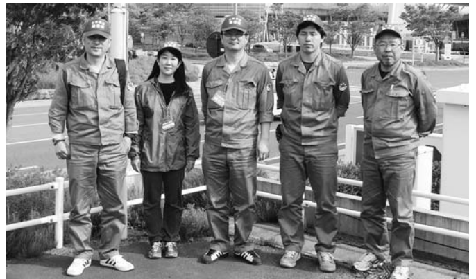
連合ボランティア第6陣 第6班（連合長崎4名とJILAF職員1名）後方は避難所となっている「ビッグパレットふくしま」

今回、ボランティア活動に参加して色々な事を経験する事ができました。避難所では被災者の当時の話を聞いたり、沿岸部の被災地を自分の目で見て、テレビでは何度も観ている光景でしたが、改めて自然災害の恐ろしさを感じました。復旧復興まではまだまだ先は見えませんが、今後も自分にできる事があれば進んでやっていきたいと思っています。