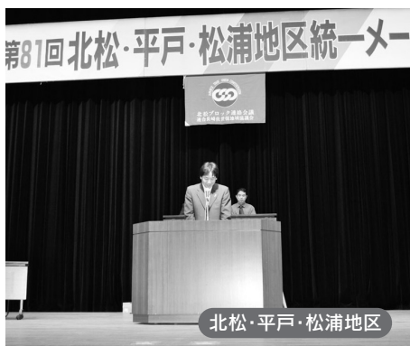
北松・平戸・松浦地区