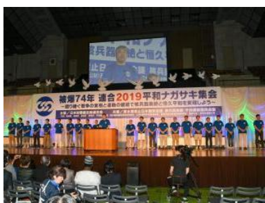
連合 2019 ナガサキ平和集会の様子