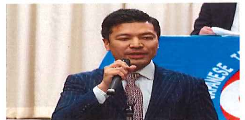
推薦決定を受けて決意を述べる