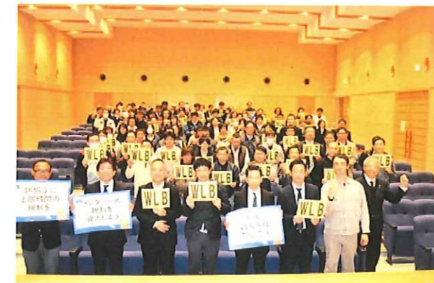
▲連合フォトメッセージ撮影

3月22日(水) 18:30～島瀬公園において、「2017春季生活闘争勝利！政策・制度要求実現！佐世保地区総決起集会」を、すべての働く者の処遇改善！「底上げ・底支え」「格差是正」でクラシノソコアゲを実現しよう！・長時間労働撲滅でハッピーライフの実現を！をスローガンに約300人の参加のもと開催。