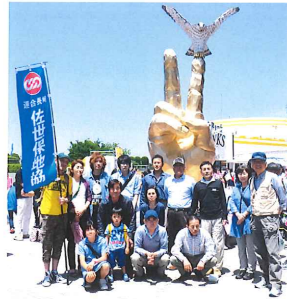
▲参加されたみなさんと一緒に