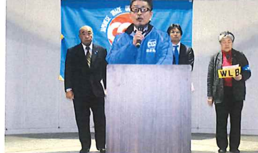
▲主催者を代表して菊永議長挨拶