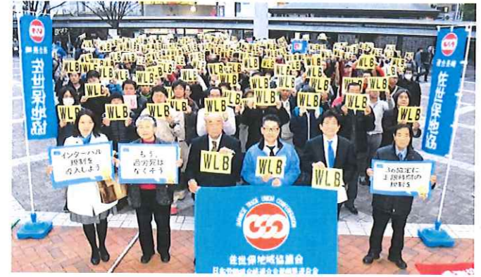
▲連合フォトメッセージ撮影