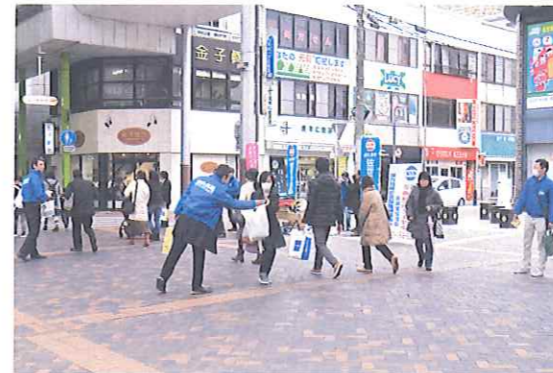
▲ひとりで悩まず連合へ