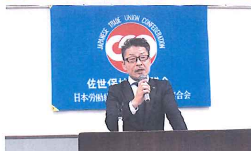
▲ 主催者代表・菊永議長あいさつ