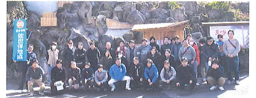
▲集会参加者全員で