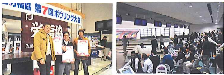
▲ 優勝：チーム東やんチーム