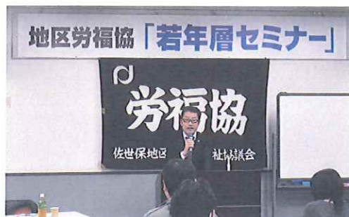
▲ 主催者代表・菊永会長あいさつ