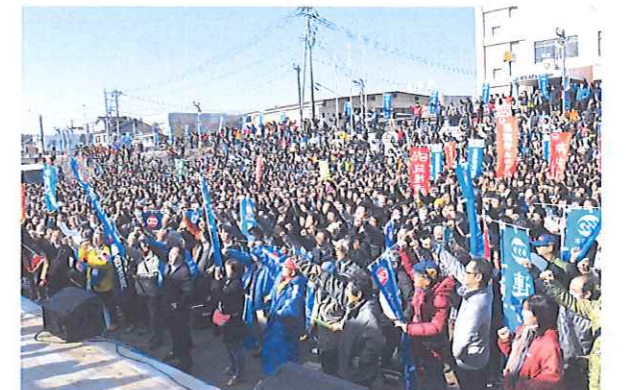
▲集会参加者 5000 人でガンバロー三唱

連合九州ブロック連絡会および連合大分主催による「在日米軍基地の整理・縮小」と「日米地位協定の抜本見直し」を実現する1.28日出生台集会が、1月28日(土)13:00~大分県玖珠町河川敷で、約5,000人の参加のもと開催されました。