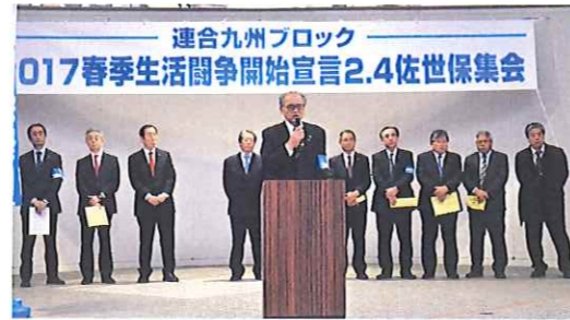
▲主催者代表 九プロ代表 連合福岡高島会長挨拶