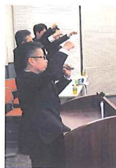
▲ 菊永議長によるガンパロー三唱