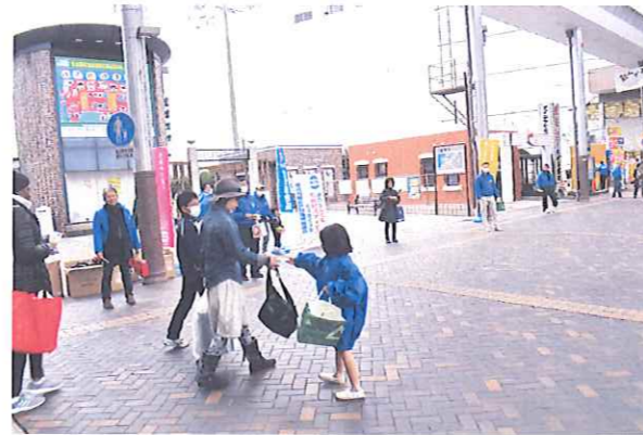
▲労働相談が実施されます