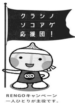
RENGOキャンペーン 一人ひとりが主役です。