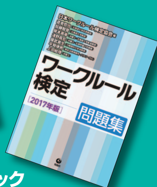
公式テキストブック